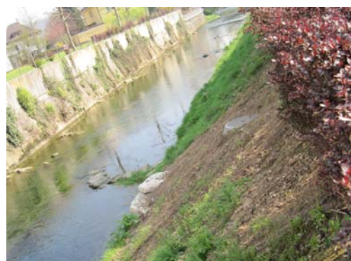
Impact minimal sur les berges de l'Allaine