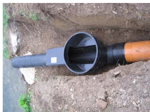
Installation d'un clapet anti-retour