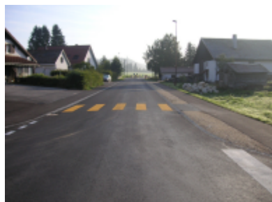
Traversée du village après travaux