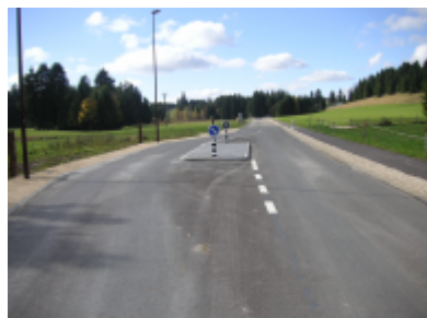
Îlot modérateur à l'entrée du village