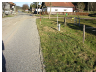
Traversée du village avant les travaux